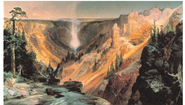
MONTAÑAS PINTADAS Eduardo Martínez de Pisón. Pág. 163