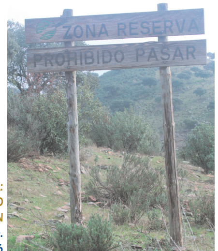
LA MONTAÑA: LIBERTAD Y REGULACIÓN José María Nasarre. Pág. 126